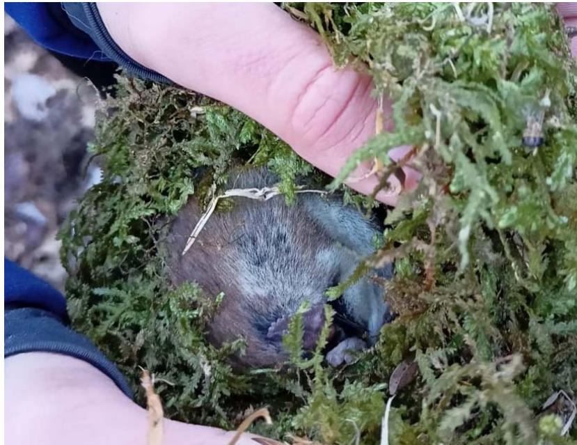
rata cellarda hivernant en un niu de mallerenga dins la capsua niu