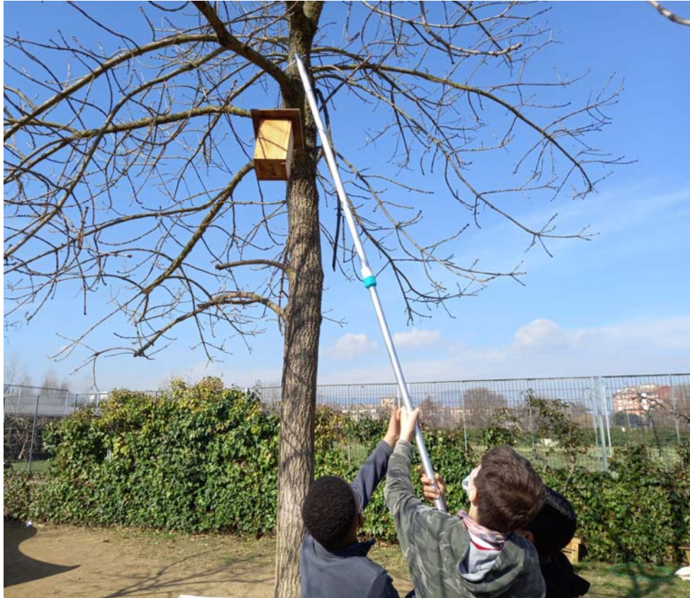
perxa per pujar i baixar les capses niu d'ocells