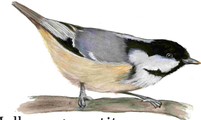
Mallerenga petita (Periparus ater)