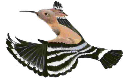
Puput ( Upupa epops )