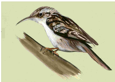
Raspinell (Certhia brachydactyla)