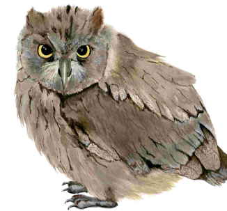
Xot ( Otus scops )