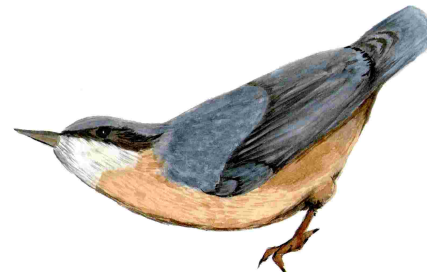
Pica-soques blau (Sitta europaea)