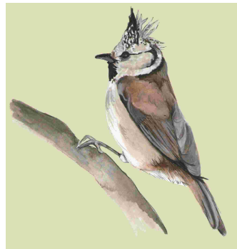
Mallerenga emplomallada (Lophophanes cristatus)