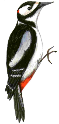
Picot garser gros ( Dendrocopos major )