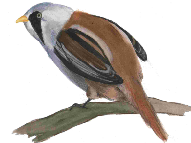
Mallerenga de bigotis (Panurus biarmicus)