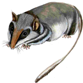
Rata cellarda ( Eliomys quercinus )