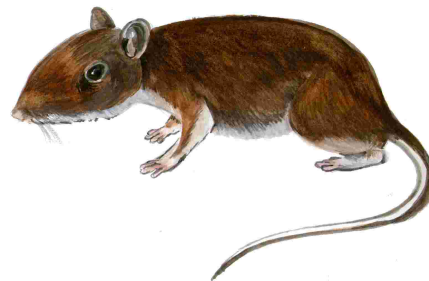
Ratolí de bosc ( Apodemus sylvaticus )