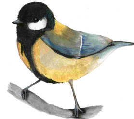
Mallerenga carbonera (Parus major)