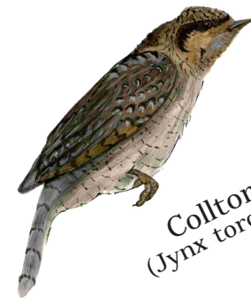
Colltort (Jynx torquilla)