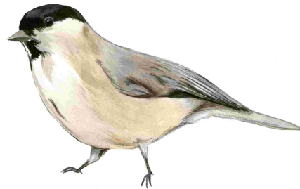
Mallerenga d'aigua (Poecile palustris)