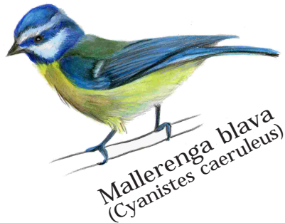
Mallerenga blava (Cyanistes caeruleus)