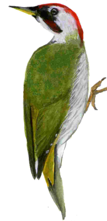
Picot verd ( Picus viridis )