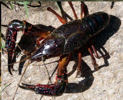
CRANC VERMELL AMERICÀ ( Procambarus clarkii )