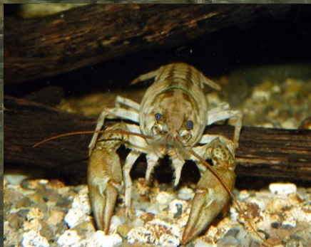
CRANC DE RIU AUTÒCTON ( Austropotamobius pallipes )

És important que les persones coneguem el problema, per no seguir escampant les espècies de cranc invasores pels rius i preservar els ecosistemes fluvials.