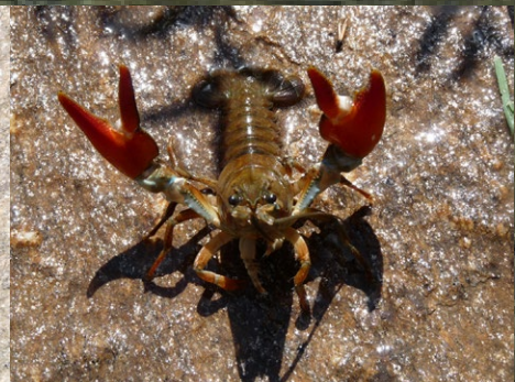
CRANC SENYAL AMERICÀ ( Pacifastacus leniusculus )