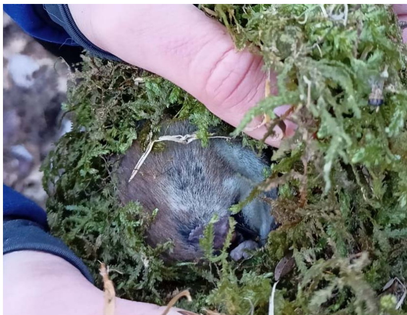
rata cellarda hivernant en un niu de mallerenga dins la capsa niu