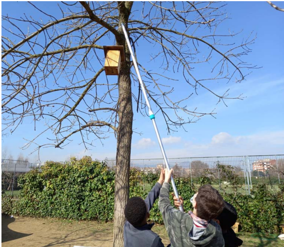
perxa per pujar i baixar les capses niu d'ocells