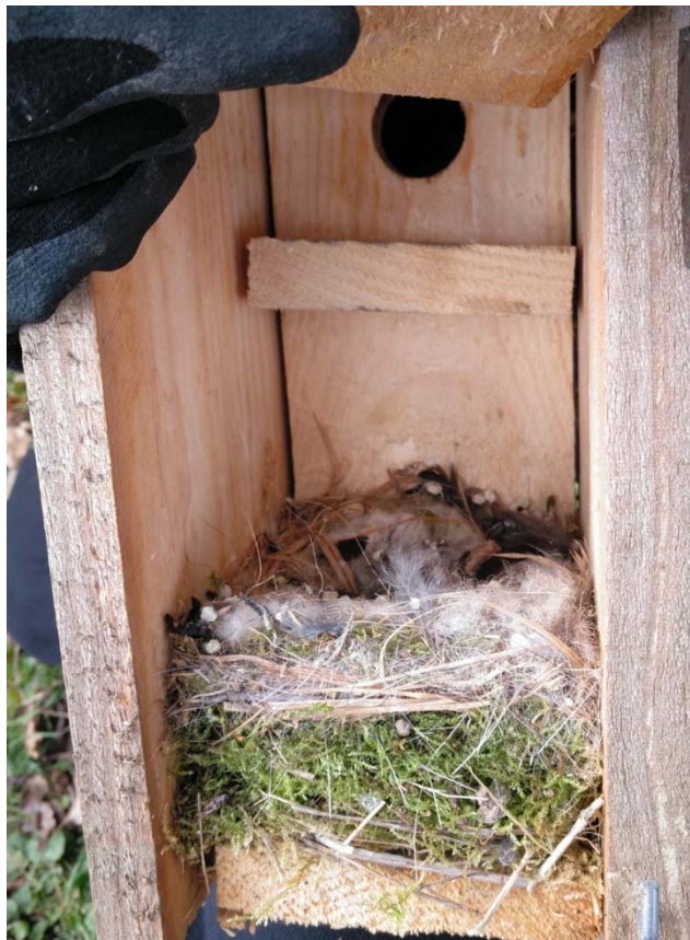
capsa niu de mallerenga ocupada amb dos nius